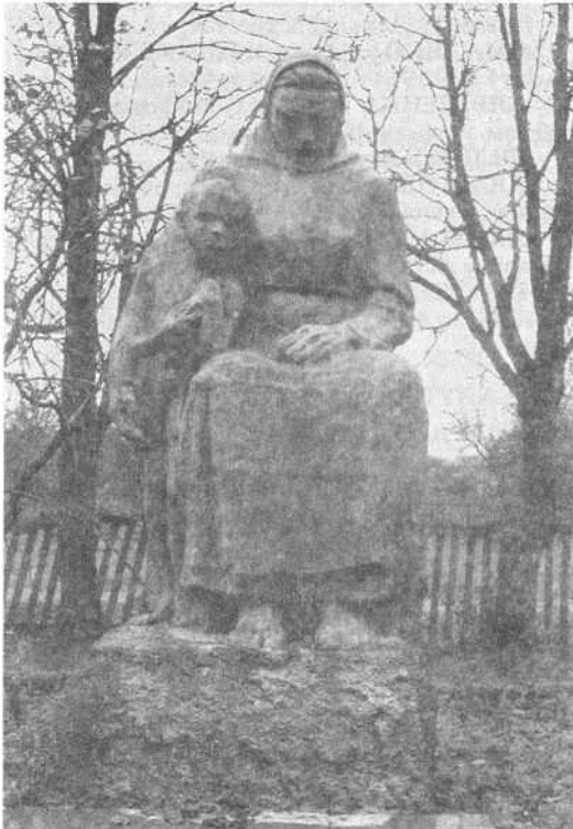
Помнік землякам у в. Лугы.