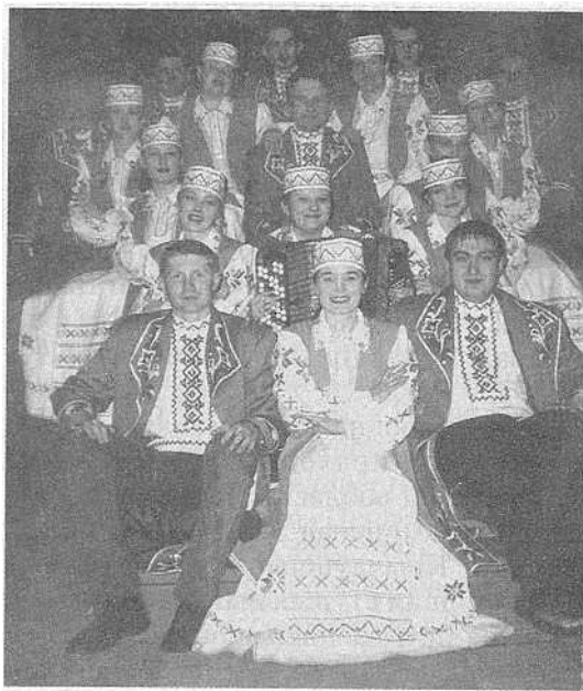
Народны ансамбль беларускай песні і музыкі «Крэчуты».

Народны ансамбль беларускай песні і музыкі «Крэчуты». Створаны