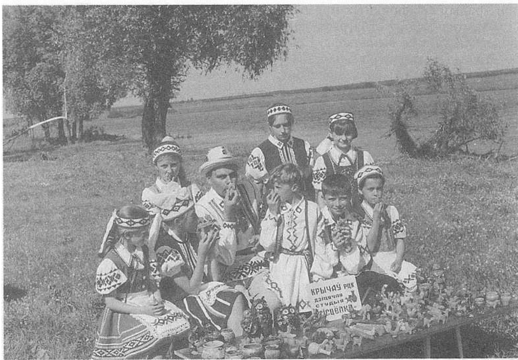
Дзіцячы народны калектыў дэкаратыўна-прыкладнога мастацтва «Свістулька».