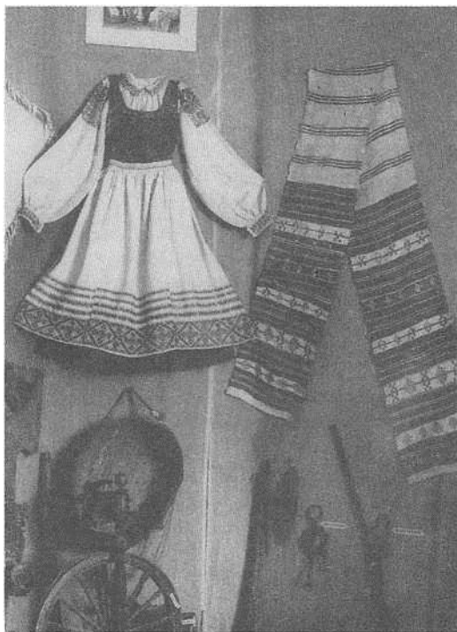
У музеі Сакольнідкай сярэдняй школы.