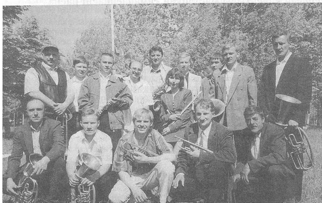
Духавы аркестр г. Крычаў.