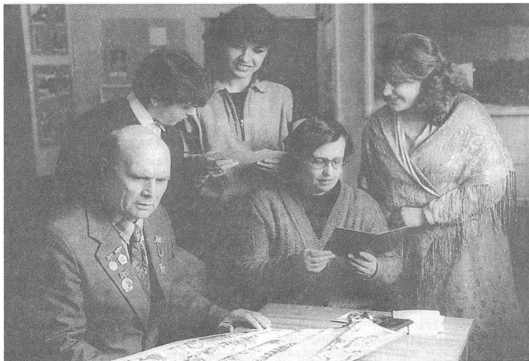
У Крычаўскім краязнаўчым музеі.

Радус-Зяньковіча, падзеі рэвалюцыі 1905-1907 гг. Экспазіцыя, прысвечаная Вялікай Айчыннай вайне, размешчана на пл. 50 м 2 . Экспануюцца матэрыялы аб пачатковым перыядзе вайны: карта-схема лініі фронту ў раёне Крычава ў ліпені – жніўні 1941г., рэшткі самалёта лётчыка А.В.Гуменнікава, на якім ён здзейсніў паветраны таран над роднай вёскай Бель, схема бою каля в.Сакольнічы, фатаграфіі, дакументы, асабістыя рэчы, зброя ўдзельнікаў баёў на Крычаўшчыне, у т.л. генерал-маёра П.П. Корзуна, камандзіра 20-га стралковага корпуса С.І. Яроміна, артылерыста М.У.Сірацініна і інш.; аб узнікненні і разгортванні