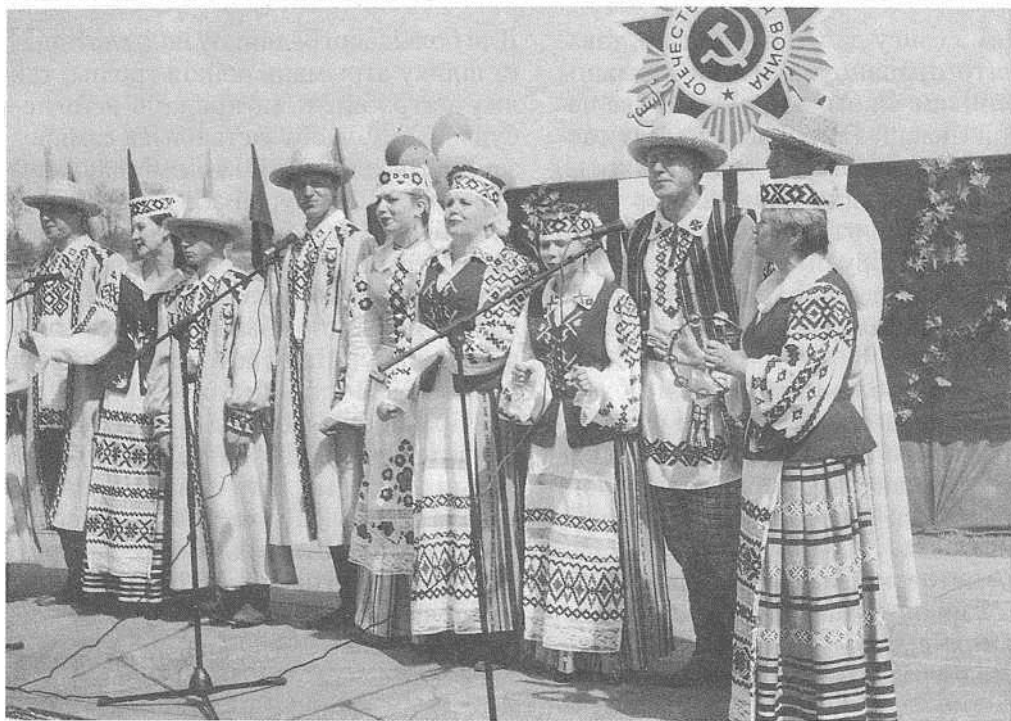
Народны ансамбль песні і танца «Вітанне».