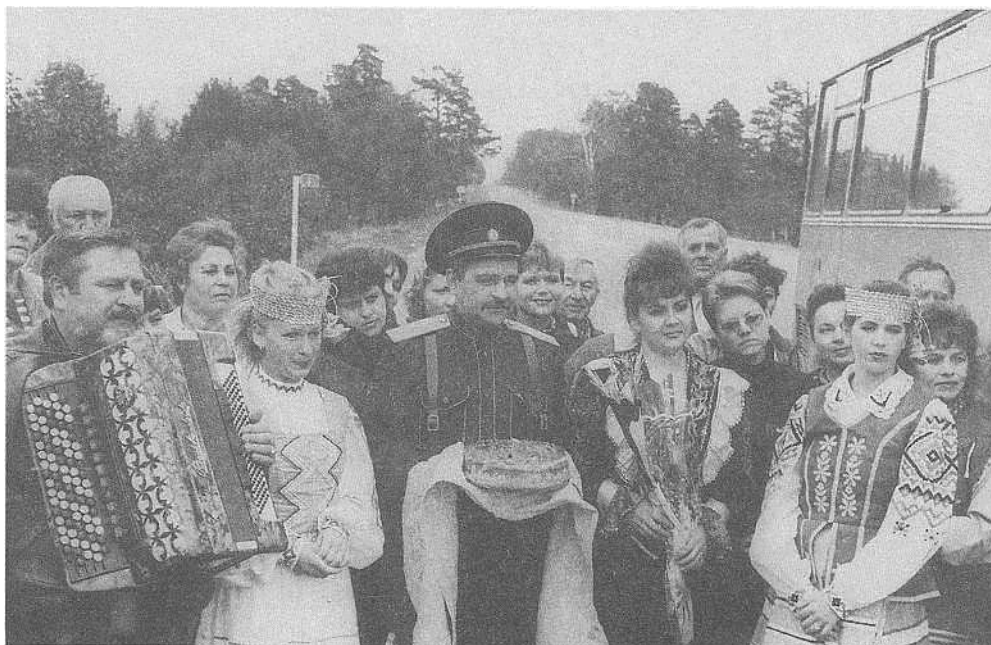
«Кубанскія казакі» на мяжы з Расіяй.

ў 1998 г., званне народнага присвоена ў 2001 г. Кіраўнік В.В. Талтонава. У рэпертуар калектыва ўваходзяць беларускія народныя песні розных жанраў: жартоўныя, лірычныя, сямейна-бытавыя, каляндарна-абрадавыя. Творчая біяграфія калектыва батата на падзеі. Ансамбль быў удзельнікам фестывалю славянскай пісьменнасці ў 1999 г. ў Рослаўлі, у 2002 г. стаў лаўрэатам міжнароднага фестывалю «Порубежы», які праходзіў у г. Шумячы Смаленскай вобласці. Часта выступаў з канцэртамі перад гараджанамі і вяскоўцамі Крычаўшчыны.