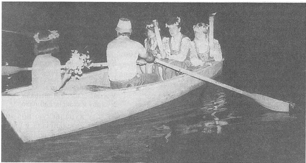
У купальскую ноч.

Кожны прысутны абавязкова пераскокваў церыз вогнішча. На агні спальвалі «май» – засохлую зеляніну, якая вывешвалася у хатах на Тройцу. Тэты дым лічыўся ачышчальным і гаючым, ім не толькі акурвалі дзяцей, хворых, але нярэдка вакол вогнішча абводзілі жывёлу. У некаторых месцах кідалі ў агонь усялякія прадметы і прыгаварвалі: «Каб гадавалася скаціна», «Зарадзі, жыта», «Зарадзі, лён». Каб ахаваць ураджай ад вядзьмарак і ведзьмакоў, у жыта кідалі галавешку з купальскага вогнішча.