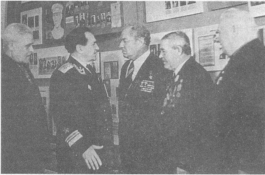
Удзельнікі ўсесаюзнага злёту «Арляня» у Крычаўскім краязнаўчым музеі.