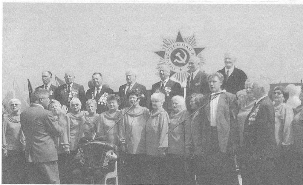
Хор ветэранаў вайны і працы г. Крычаў.

рэпертуар аркестра ўваходзяць творы розных жанраў: танцавальная музыка, а таксама творы замежных, рускіх і беларускіх аўтараў, уласныя інструментоўкі ўдзельнікаў аркестра. Адзін з асноўных напрамкаў творчасці калектыву – вакальнае выкананне ў суправаджэнні аркестра. Аркестр прымаў удзел у 2001 г. у абласным фестывалі «Па галоўнай вуліцы з аркестрам...», у рэгіянальным аглядзе мастацкай самадзейнасці, выступаў у многіх гарадах рэспублікі.