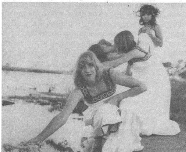
Дзяўчаты пускаюць на ваду вяночкі.

Хлопцы і дзяўчаты ды людзі пажылога ўзросту спраўлялі абавязковае купанне ў раках, азёрах ці вадаёмах. Бо купальская вада, па паданню, валодае жыватворнай, гаючай і пладаноснай сілай, ад яе людзі робяцца прыгожымі.