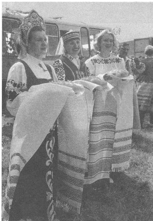
Сустрэча артыстаў ансамбля.